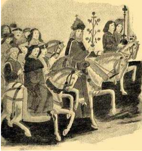
A konstanzi zsinat felé