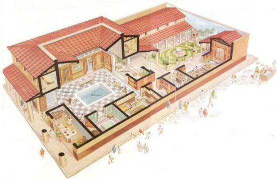
A római ház

http://tortenelemppt.blogspot.hu/2012/08/romai-hetkoznapok-unnepek.html (2017.01.03.)