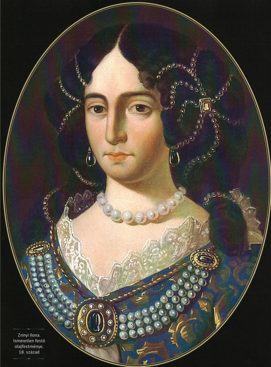
Zrínyi Ilona. Ismeretlen festő olajfestménye, 18. század

Ez persze nem is célunk, csupán néhány gondolattal szeretnénk áramolni a köztudatban róla kialakult benyomást változó történelemszemléletünk időszerű problémafelvetéseinek tükrében és az újabban felmerült kutatási eredmények alapján, amelyek széles körben talán még nem kellően ismertek.