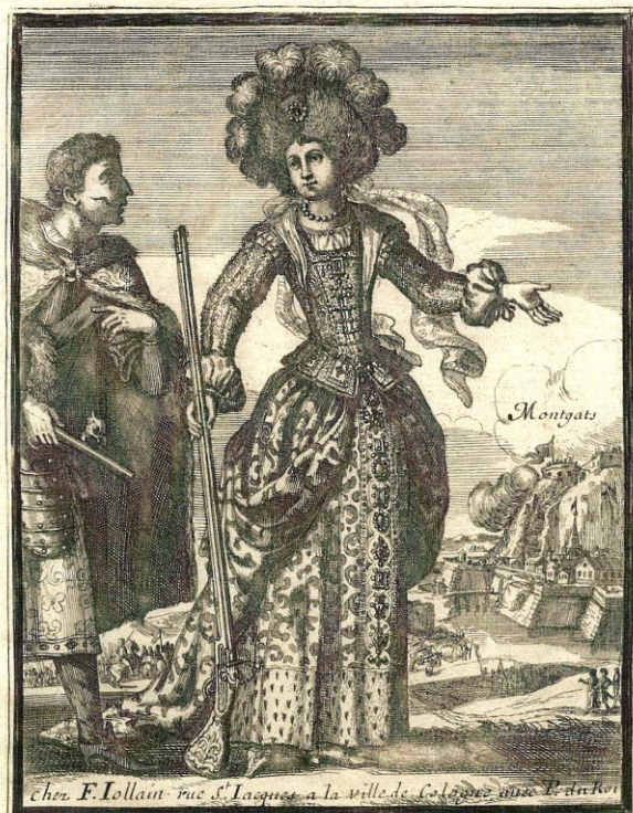
cher F. Jollain rue S. Jacques à la ville de Collogne avec P. de... La Princesse Sophie Ragotsky Femme du Comte Tékely, Soutenu les Intérêts de la dans la Ville et château réusement aux Turcs et Im- attaques de ses Ennemis. Sœur du Comte de Serin et dont elle a très généreusement soutenu les Intérêts pour de Montgats résistant vigou- reusement aux plus fortes