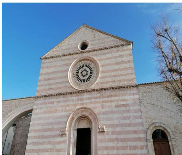
3. Assisi – Basilica di Santa Chiara

k -l) Rögzítse a sorba nem illő kép két stílusjegyét!