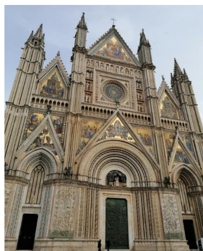
2. Orvieto - Cattedrale di Santa Maria Assunta)