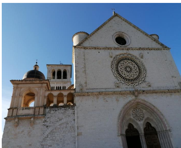
1. Assisi - Szent Ferenc bazilika