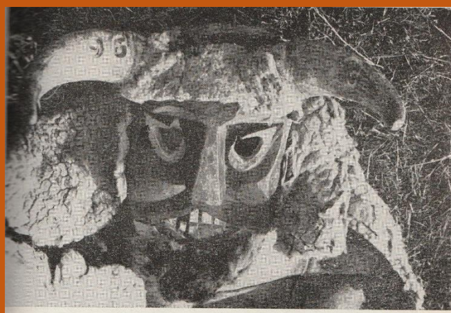
Busó-maszkos alak. Mohács, Baranya m.