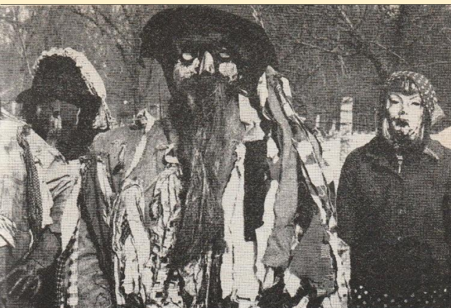
Farsangi maszkos alakok. Moha, Fejér m.