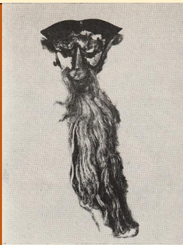
Farsangi maszk. Moha, Fejér m.