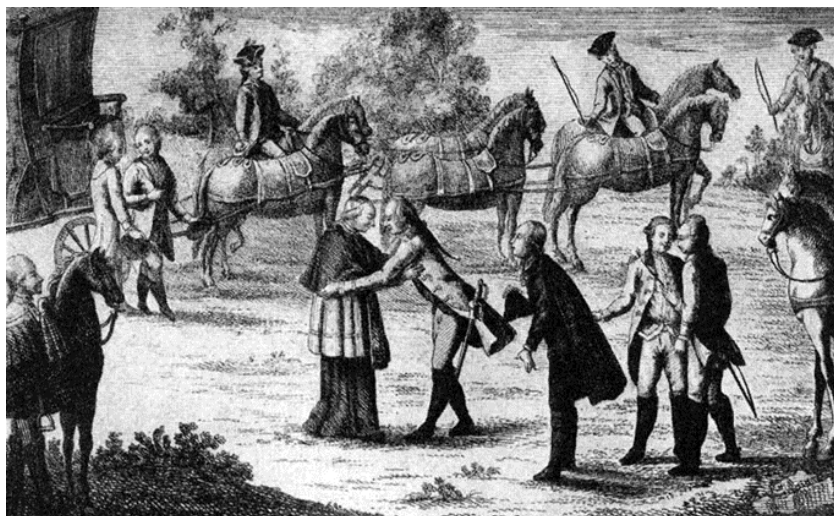
VI. Pius pápa és II. József találkozása Bécsben.

„Minden olyan nyilvános vallásgyakorlattal nem bíró helyen, ahol van száz nem katolikus család, s ezeknek van elegendő, törvényes úton biztosított fedezetük imaházak, lelkészlakok, tanítólakások építésére, s ahol a lelkészek és tanítók megfelelő állásáról gondoskodni képesek anélkül, hogy a szolgáltató népet ezekkel a hozzájárulásokkal túlságosan megterhelnék, avagy a reá háruló közadók viselése szempontjából meggyengítenék, legyen szabad ugyanazon nem katolikus, vagyis az ágostai és helvét hitvallásúaknak, avagy a görög szertartású nem egyesülteknek magánimaházakat oly módon felépíteni, hogy ezeknek se tornyuk, se harangjuk, se közútról nyíló bejáratuk – olyan, amilyen a nyilvános templomoknak van – ne legyen” (II. József türelmi rendelete)