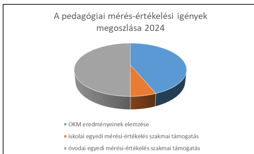
2. ábra: Mérés-értékelési témájú nevelőtestületi igények 2024

A pedagógiai-szakmai szolgáltatások területéről rendszeresen mutatkozik érdeklődés a mérés-értékelési szolgáltatások iránt, a kitöltők 15,09%-a, 16 intézmény kér valamilyen pedagógiai mérés-értékelési segítséget, helyi nevelőtestületi értekezletet, felkészítést, elemzést, fejlesztési tervet az intézmény helyszínén. Az igényelt témák a következők: OKM eredményeinek elemzése 5-6 évre visszamenően iskolára és tanulóra, FIT elemzés értelmezése, pedagógiai méréssel és értékeléssel kapcsolatos egyedi szakmai támogatás pl. az iskola belső méréseinek, vizsgálatának elemzése, az óvodai mérés dokumentálása, megfigyeléses módszerek az óvodában) (2. ábra). A konkrét mérés-értékelési témájú műhelymunkák, rövidebb képzések iránti igény a standard rövid szakmai programjainkat igénylők bemutatásánál jelenik meg.