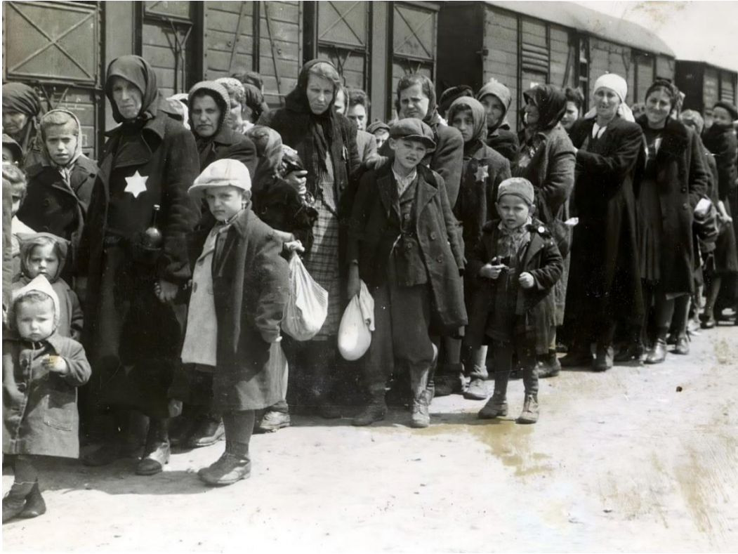
10. kép: Auschwitz: Magyar zsidók érkezése