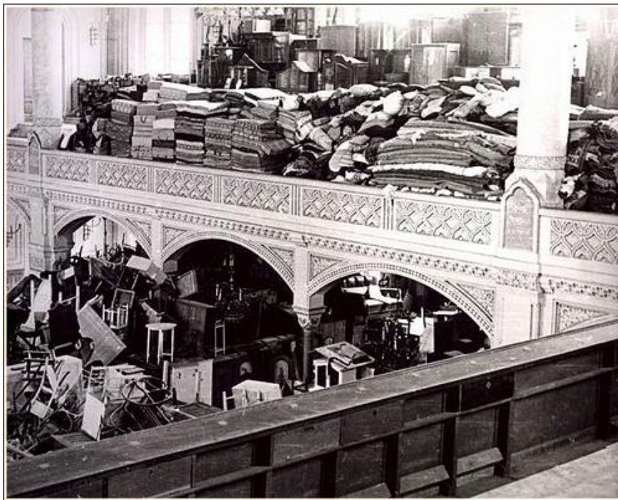
9. kép: A szegedi zsidóságtól elvett tárgyak a zsinagógában