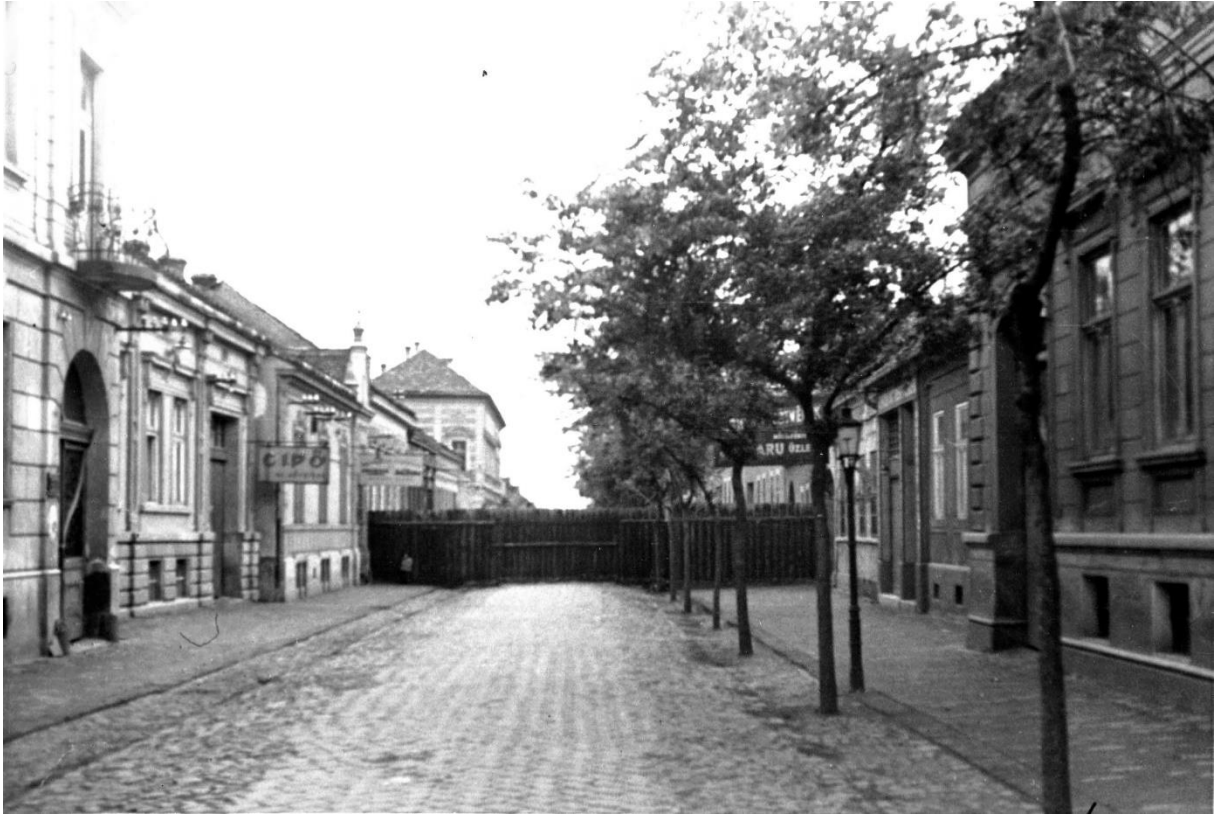
4. kép: Debreceni gettó kerítése