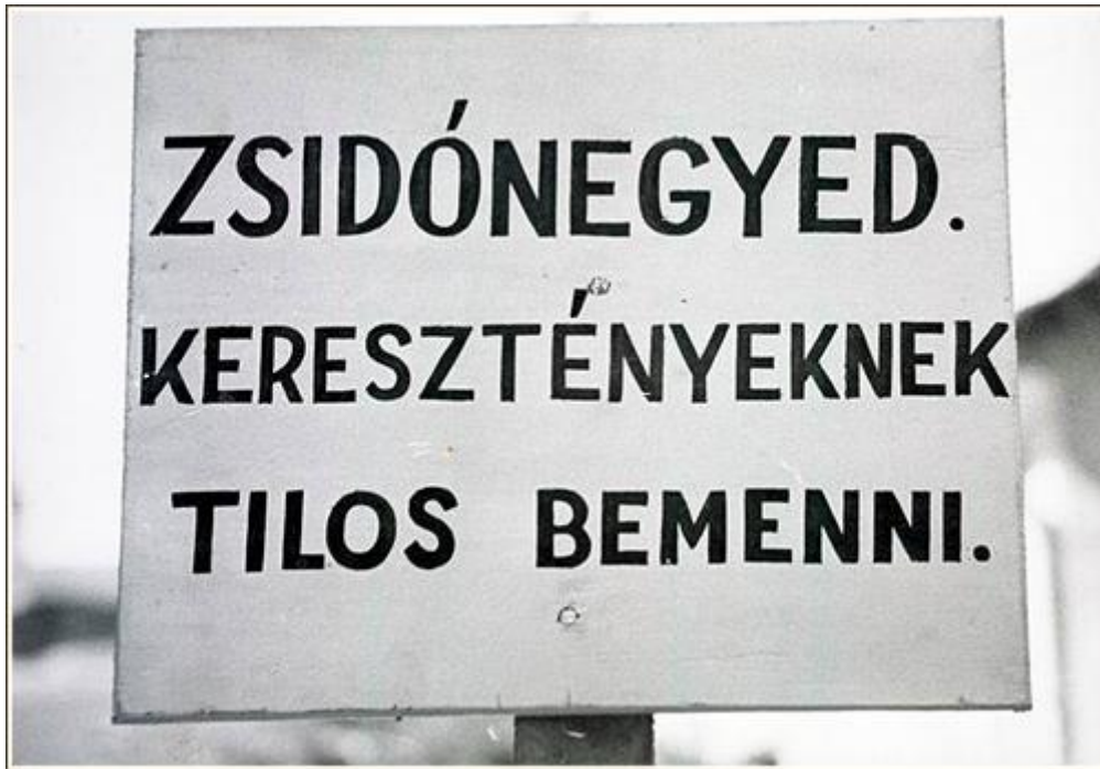
5. kép: Zalaegerszegi gettó bejárata