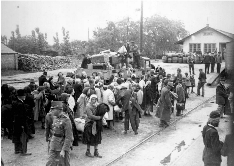
8. kép: Kőszegi zsidók deportálása