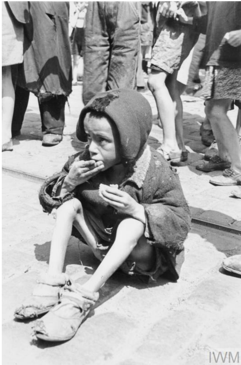
7. kép: Gyermek a varsói gettóban