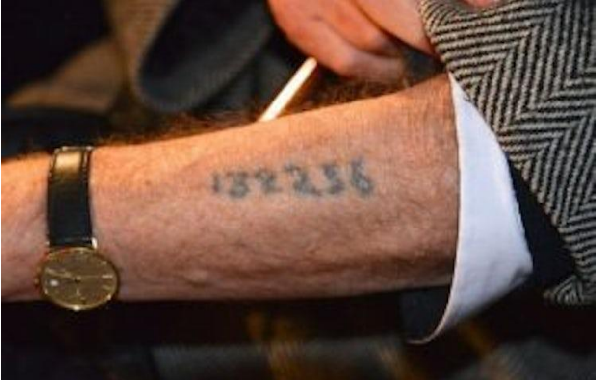
12. kép: Túlélő, karján a tábori számával