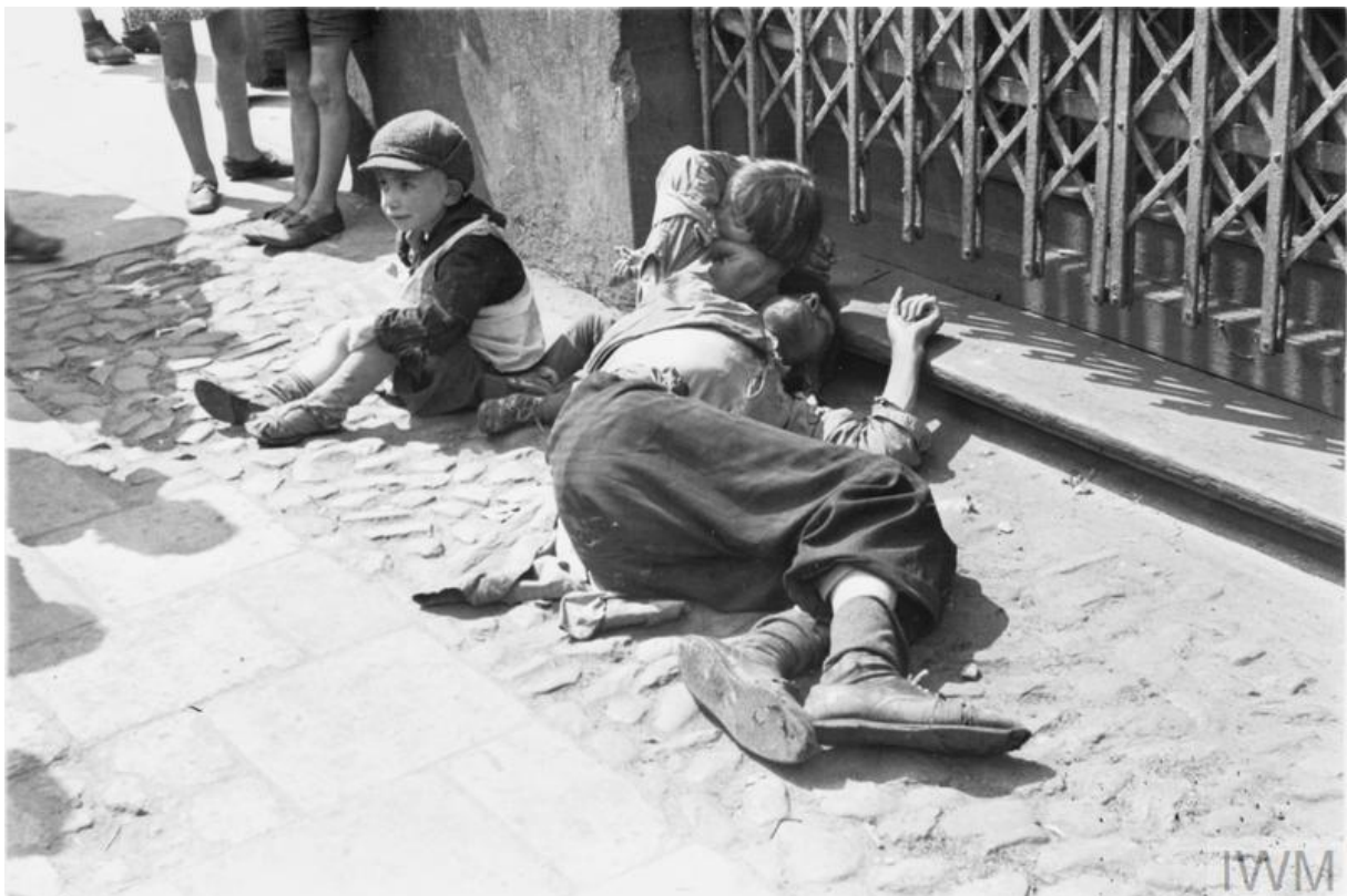
6. kép: Életkép a varsói gettóból