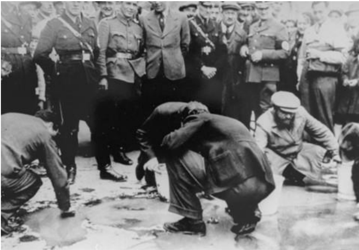
1. fotó: Bécs: Zsidók tisztítják a teret 1

( Ezra Péri visszaemlékezése, 1938 Ausztria - „But the story didn't end that way...” 40.p. )