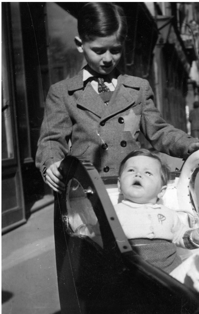
2. kép: Budapesti utcakép 1944-ből