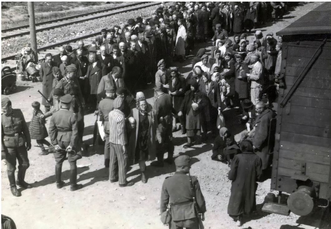
11. kép: Auschwitz: Magyar zsidók érkezése 2