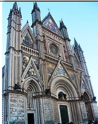
Orvieto – dóm - 2013.11.01

7. Nevezze meg, milyen stílusirányzatra jellemző jegyeket ismer fel a képen látható épületen!