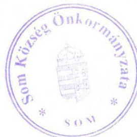
Kovács Szilveszter polgármester