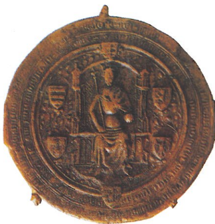
Az Aranybulla pecsétje

Birtokaikra megkapták az immunitást (mentességet). Katonáskodási kötelezettségük csak védekezés esetén volt egyetemlegesen érvényes, támadó hadjáratokban az uralkodónak kellett a költségeket fizetnie. Az összes szerviensek joga volt az évenkénti székesfehérvári törvénynapon megjelenni. Jogot adott az Aranybulla arra, hogy a szerviensek a saját birtokaikon élő alávetett népesség felett ítélkezhessenek (ebből alakulhatott ki a későbbi úriszék). Rendelkeztek a szabadon védekezés jogával, vagyis csak a per és a bírói eljárás után lehetett börtönbe zárni őket. Mindezek a rendelkezések később a nemesség „ sarkalatos jogaiává ” váltak.