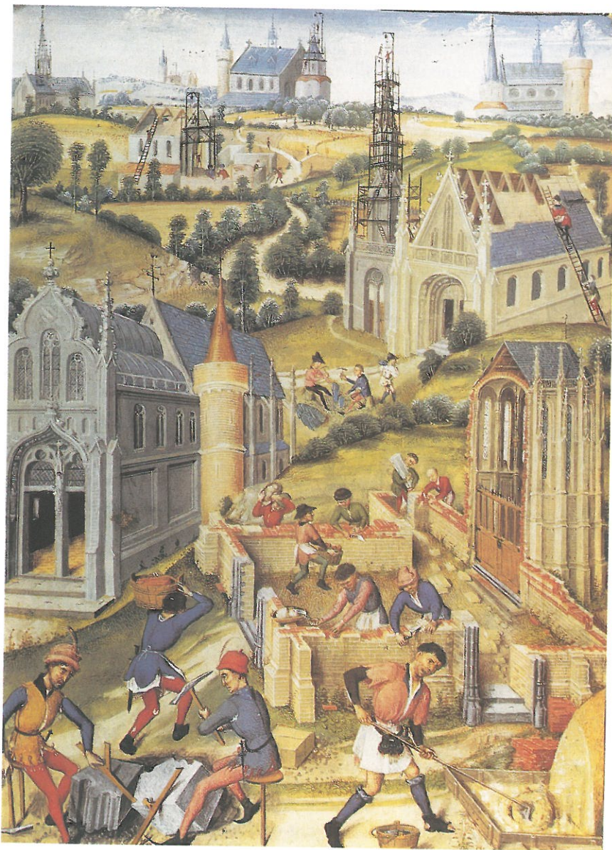
A katedrális építése

a 13. századi Londonban is sor került. Ezt mi sem bizonyítja szebben, mint a század végéről származó, légszennyeződés miatti tiltakozások. 1388-ban már a parlamentnek kellett az ügygel foglalkoznia! A középkori technika csúcspontját a hihetetlenül precíz, fogaskerekes óraművek megszerkesztése jelentette, mellyel a kor műszaki megoldásai a zenitre érkeztek.