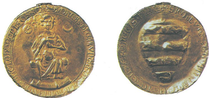
Uralkodói pecsét két oldala

A birtokadományozások legfőbb haszonélvezői közé tartoztak a „ merániak ”, akik Gertrúddal (András feleségével) együtt jöttek Magyarországra az isztriai és krajnai területekről. Gertrúd egészen biztosan kezdeményező szerepet játszott az ado-