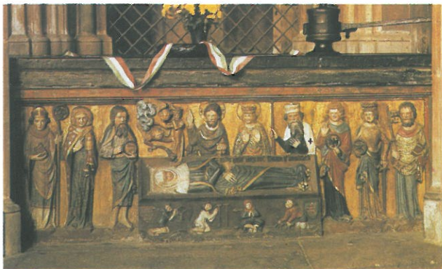
Szent Erzsébet szarkofágja

Az külpolitikában ebben az időszakban is folytatódtak a korábbi halicsi hadjáratok , s többszöri kudarc után csak 1232 -ben értek véget. A másik kérdés a kun térítés ügye volt. A keleti terjeszkedés eredménye volt valószínűleg az a hír, hogy valahol keleten magyarul beszélő nép él. Riccardus domonkos rendi barát jelentése alapján négy tagból álló misszió indult 1232 -ben az ott élő magyarok megtérítésére, de csak egyikük jutott élve haza. 1235 -ben más domonkosok indultak el, s közülük az egyik Julianus barát volt. Ő megtalálta a magyarokat és tőlük értesült arról, hogy a tatárok nyugati hadjáratra készülnek, a hírrel 1236 -ban érkezett Magyarországra. Külpolitikáról szólva érdemes megemlíteni a dinasztikus kapcsolatokat , hiszen András családja igen kiterjedt volt. Három felesége közül az első, Gertrúd délnémet fejedelmi családból származott, a második a konstantinápolyi latin császár lánya volt, a harmadik pedig Itáliából került Magyarországra. Lányai közül Erzsébet volt a legismertebb, aki Lajos turingiai őrgróf felesége lett. A fiatalon elhunyt asszonyt, aki aszkézissel és betegek ápolásával töltötte életét, már 1235 -ben szentté avatták.