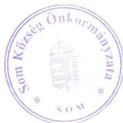
Kovács Szilveszter polgármester

felelős: Kovács Szilveszter polgármester